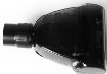
маленька турбо щітка