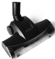
велика турбо щітка