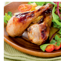
СТРАВИ З М'ЯСА