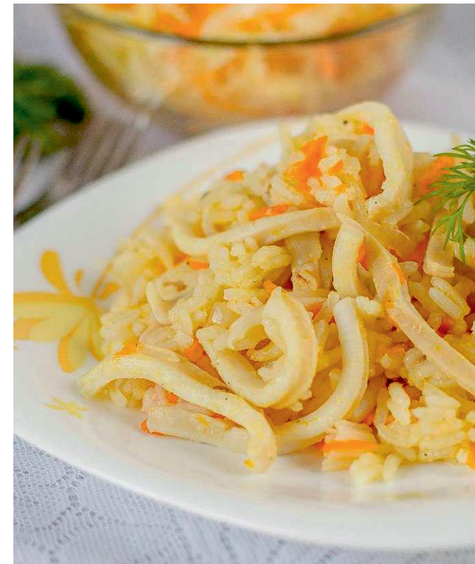
Рис та овочі промити. Нарізати помідори та перець кубиками. Приготувати соус: в чашу викласти кільця кальмарів, помідори, перець, часник, налити рослинну олію. Вибрати програму «СМАЖЕННЯ» і обсмажувати протягом 15 хвилин. Готуватиз відкритою кришкою. Коли соус буде готовий, додати рис і бульйон, закрити кришку, вибрати програму «ТУШКУВАННЯ/ПЛОВ», натиснути кнопку «СТАРТ». Готувати до закінчення програми.

2 зубчики часнику 150 г пропареного рису 300 г рибного бульйону (або води) Рослинна олія