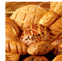
ВИПІЧКА ТА ДЕСЕРТ